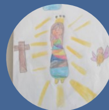
Tekeningetjes van Maria communicantjes