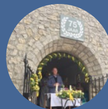
Sint Joseph kapel Hilleslagen